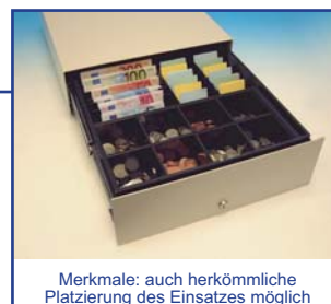
Merkmale: auch herkömmliche Platzierung des Einsatzes möglich