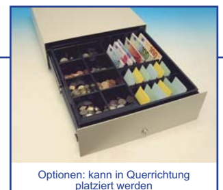
Optionen: kann in Querrichtung platziert werden